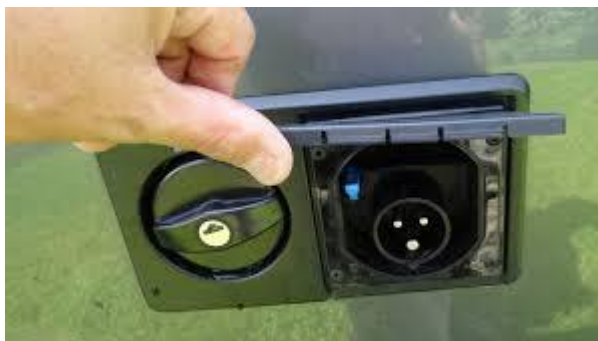
Aussenstromanschluss und Frischwasser-Wassereinfüllstutzen

Den aktuellen Ladezustand können sie auf dem zentralen Bedienfeld ersehen.