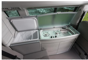
Bild Küche mit Kühlbox